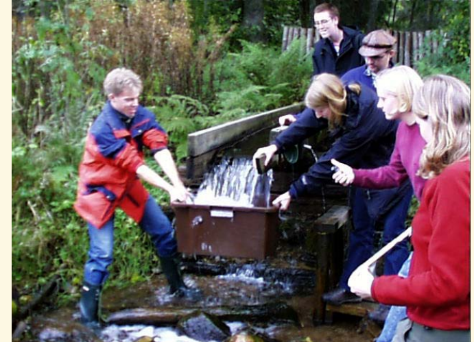
Blivande civilingenjörer på fältkurs i hydrologi.

Du kommer att kunna arbeta inom ett brett teknikområde med kompetens att kunna utveckla helhetslösningar på miljö- och vattentekniska problem.